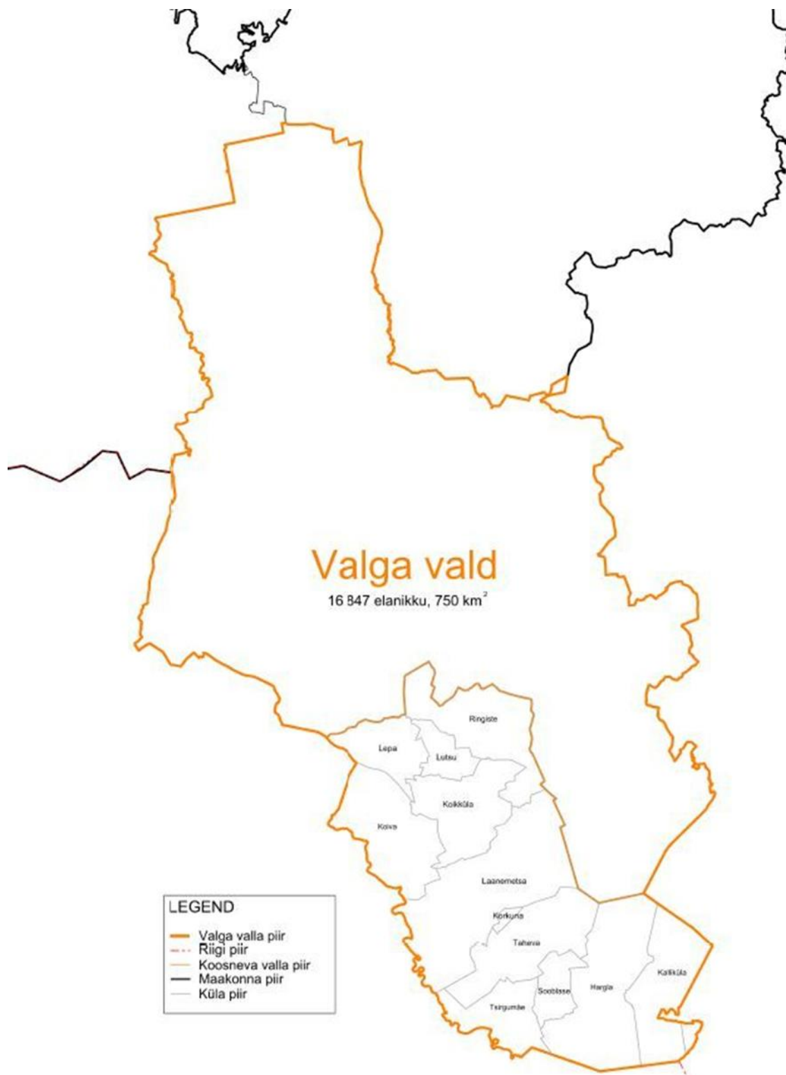
Lisa 1. Piirkonna kaart.